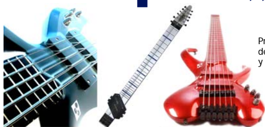
Prototipos de Bajo, Stick y Guitarra Basslab.

Durante el Seminario, se presentó el prototipo de Stick hecho por la empresa alemana Basslab ( www.basslab.de ), famosa por sus diseños y construcción de bajos y guitarras hechas con una aleación