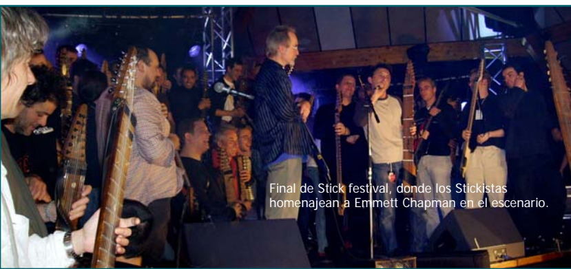
Final de Stick festival, donde los Stickistas homenajean a Emmett Chapman en el escenario.

Stick, batería y sección de vientos, para finalizar con una agrupación que unió al Stickista inglés Jim Lampi con el grupo Costik. En los entretiempos, diferentes Stickistas presentaban cortas performances. En resumen, un evento histórico donde los principales protagonistas de la escena "Stickística" europea se dieron cita allí para mostrar su arte en las 10 cuerdas.