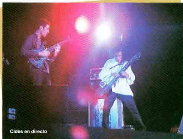
Cides en directo