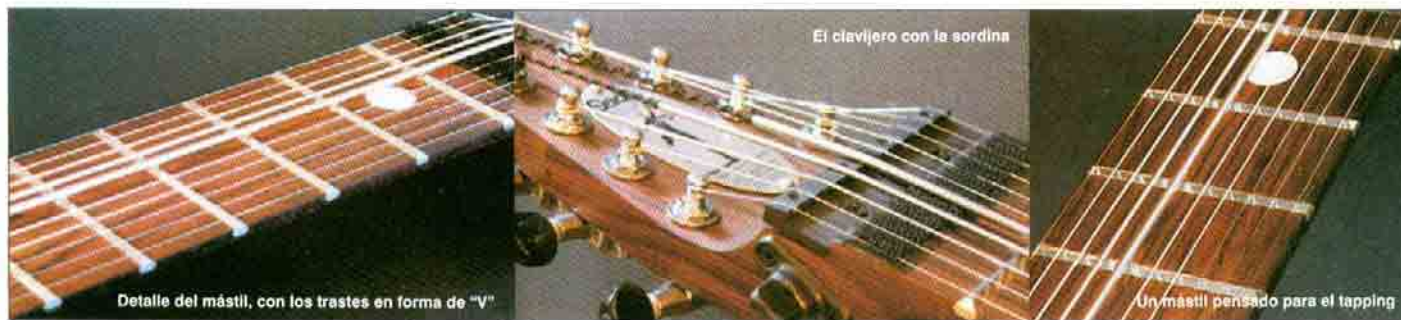
Detalle del mástil, con los trastes en forma de "V"