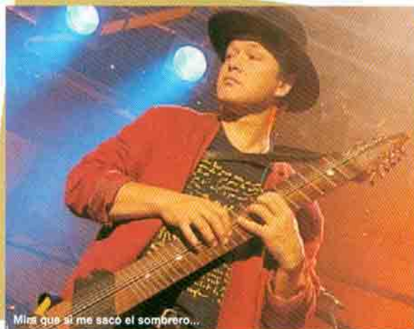
Mira que si me sacó el sombrero...

Ser un virtuoso por sí solo a mí no me interesa para nada. Si un músico cuenta una historia con un montón de sentimiento entonces su música es suficiente. El virtuosismo y la técnica son simplemente herramientas, pero pueden ser muy importantes si necesitas trasladar tu historia a la música. Cuantas más palabras sabes más puedes expresarte a ti mismo. Al final se trata de las elecciones que hagas. Algunos músicos tienen un gran diccionario pero nada que decir. Otros tienen sólo unas cuantas