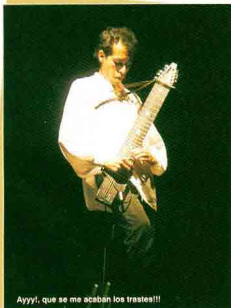
Ayyyy!, que se me acaban los trastes!!!

El registro total del stick desde su nota más