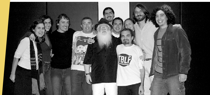
Hermeto y La Banda Hermética en un encuentro.

Banda Hermética: una agrupación que revisa y toca en directo una obra inédita de Hermeto Pascoal, el Calendario del Sonido, una canción compuesta para cada día del año.